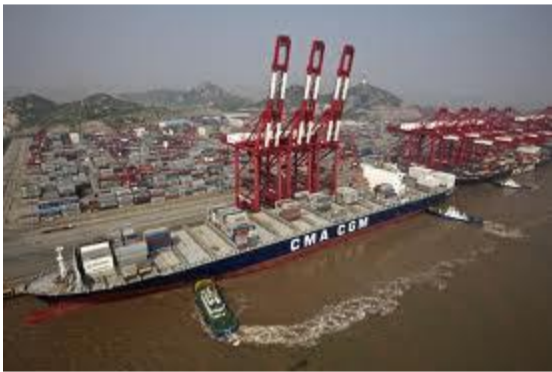
- le port de Shangai (1)