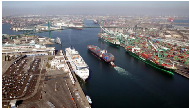
-le port de Los Angeles (2)