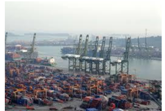
-le port de Singapour (3)

Une zone industrialo portuaire (ZIP) est un port situer au bord de la mer, une ZIP est souvent composer d'un aménagement particulier : bassin, grue, navires, portes-contenaires, zone de stockage et de zones industrielles et quelque fois la ville.