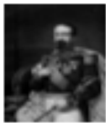
1852-1870 Second Empire (Napoléon III).