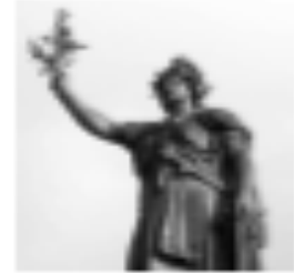
1870-1940 Troisième République.